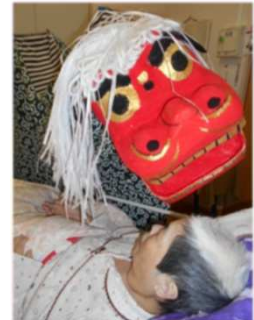
今年の獅子舞は新しくなりました！