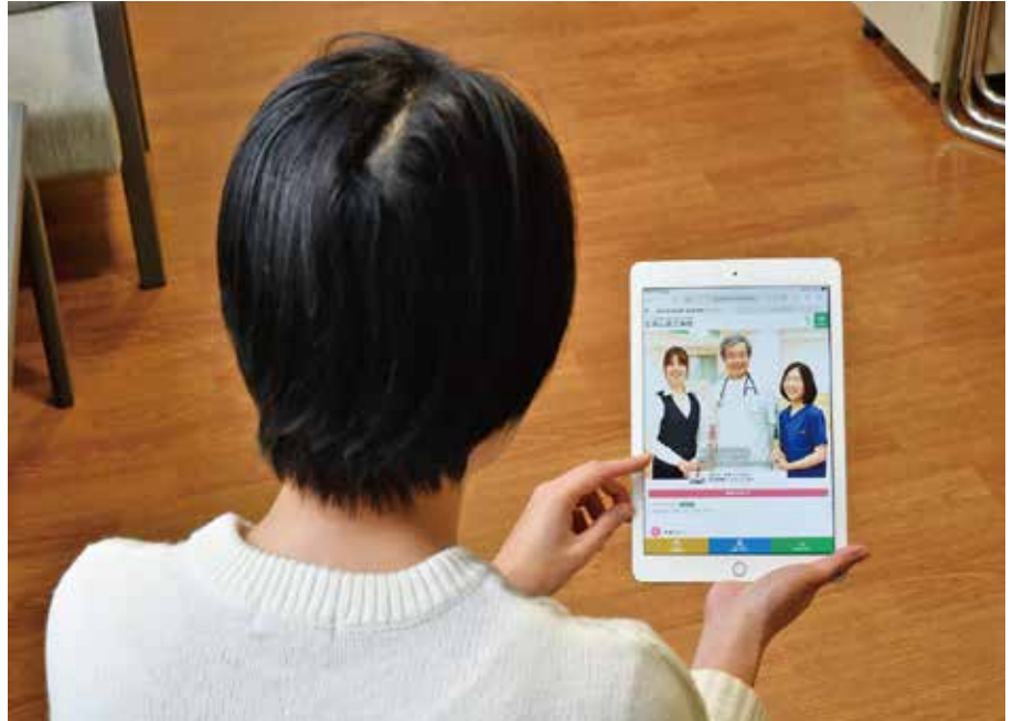
スマホやタブレットからでもしっかり見えます！