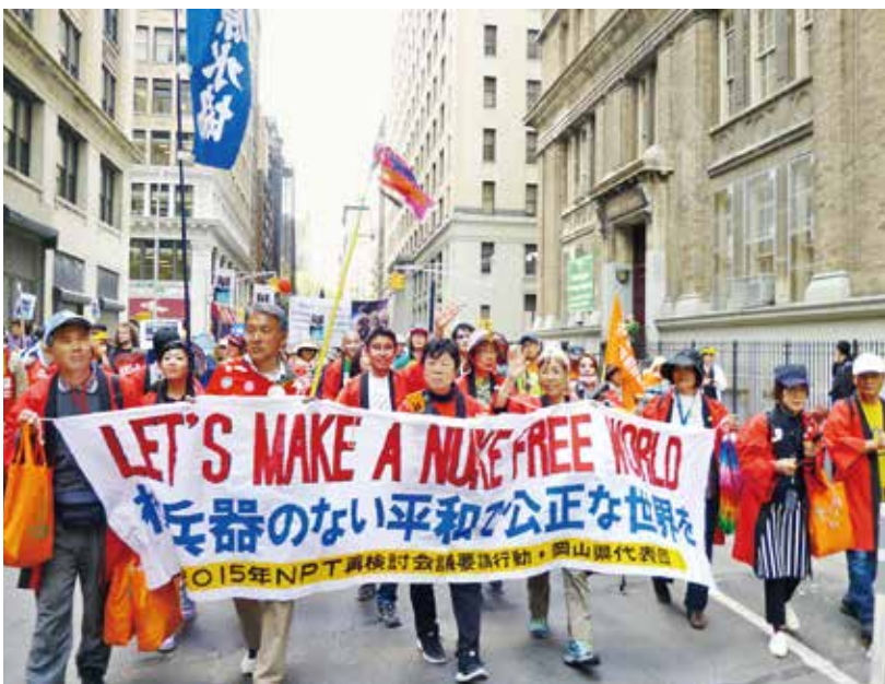
2015年NPT再検討会議 岡山県代表団のデモ行進（ニューヨーク）