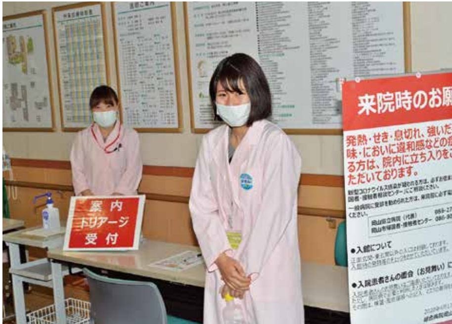
玄関にて、ご来院の方の体温チェックや手指の消毒を行っています