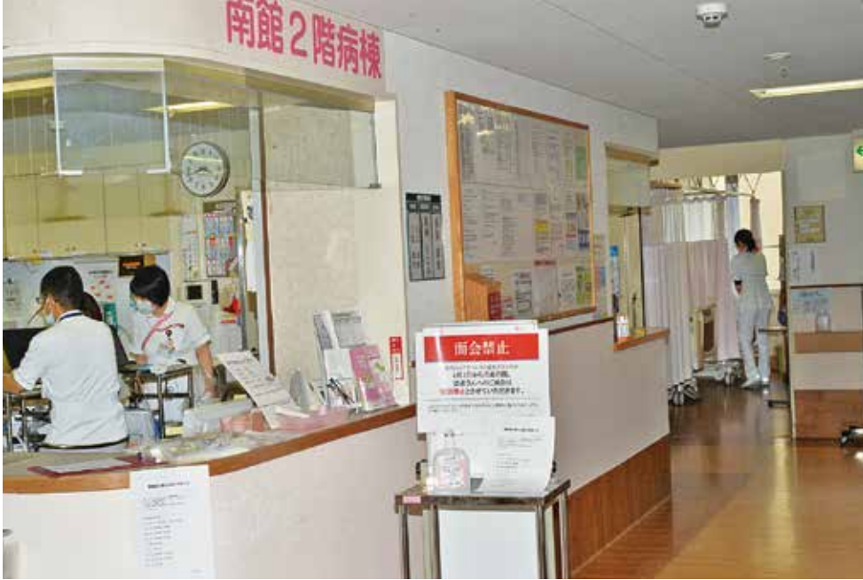
入院患者さんへのご面会は原則禁止に