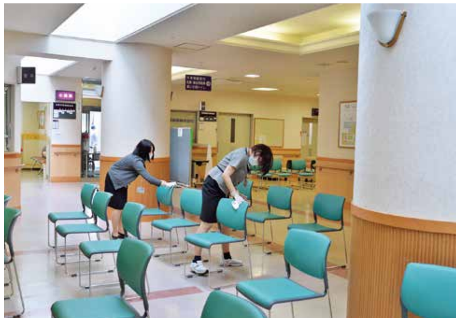
待合室の消毒作業