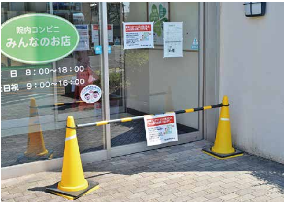
出入口は正面玄関と東玄関の2ヶ所のみ制限