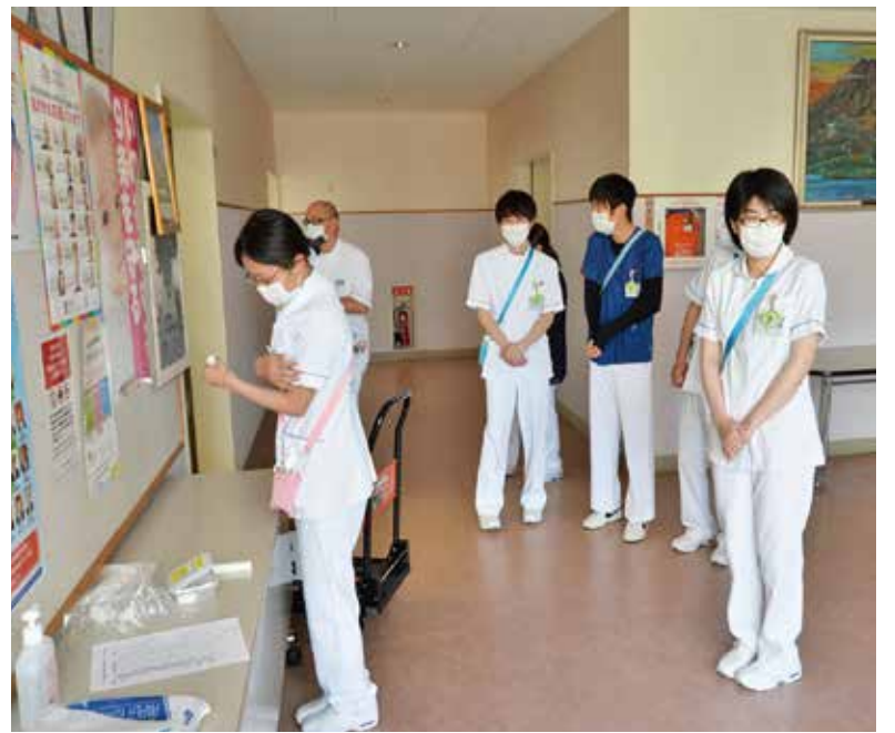
新入職員も研修の前に体温チェックを実施