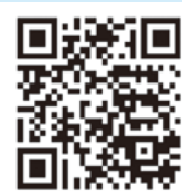
ホームページ用QRコード

岡山協立病院では、ホームページで診療予定や取り組みを随時発信しています。右記のQRコードからご覧ください。