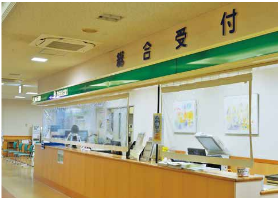
各受付窓口に飛沫防止カーテンを設置しました