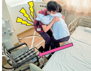
持ち上げて腰を捻る