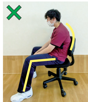
座位時は猫背・椅子の高さに注意